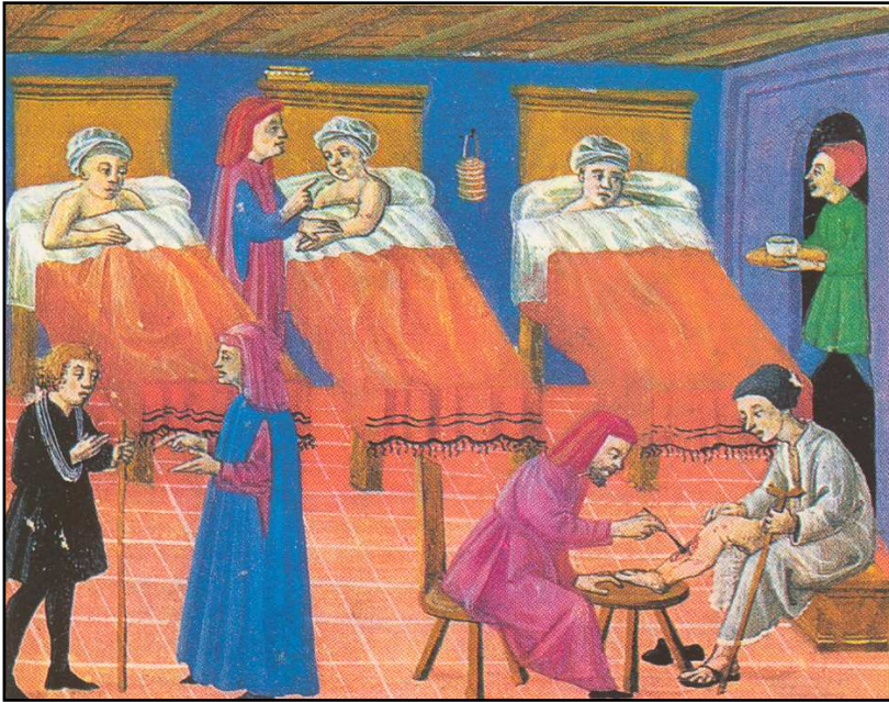
Doc. 6 : Salle d'hôpital , fin du 15 ème siècle, miniature, in Denise GALLOY et Franz HAYT, Du document à l'histoire. La fin du Moyen Âge et le XVI o siècle , Bruxelles, De Boeck-Wesmael, 1991, p. 7.